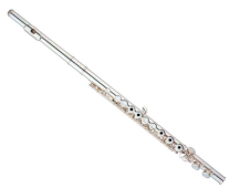
La flûte traversière