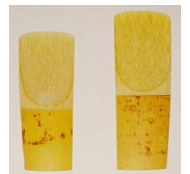
Exemples de anches